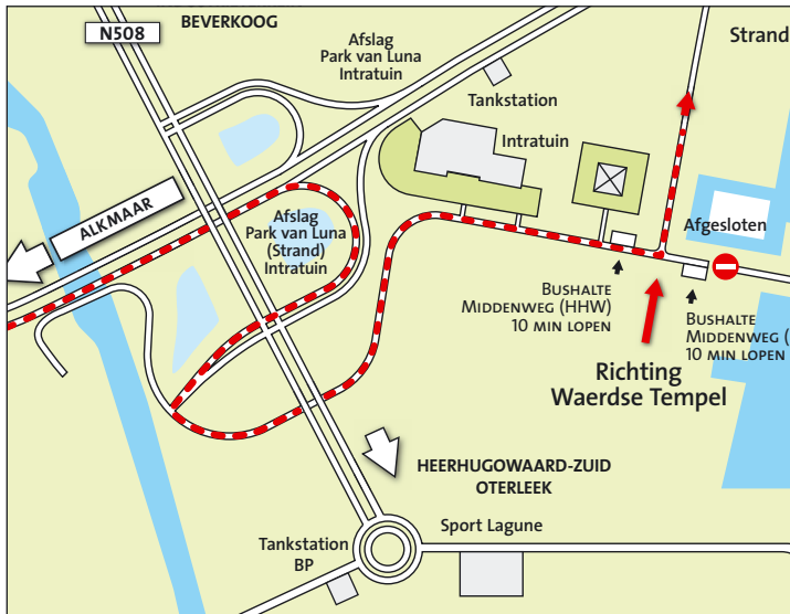
Route vanaf Alkmaar