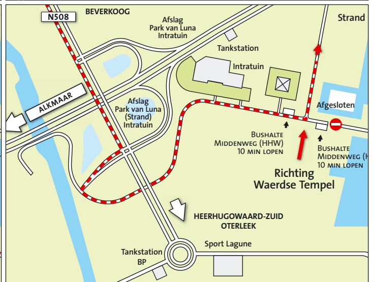
Route vanaf Alkmaar-Noord/Beverkoog