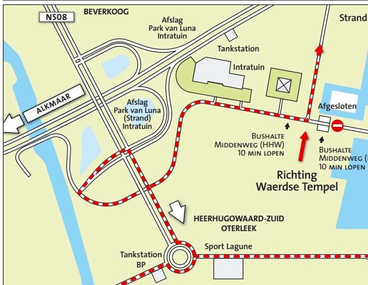
Route vanaf Heerhugowaard/Oterleek