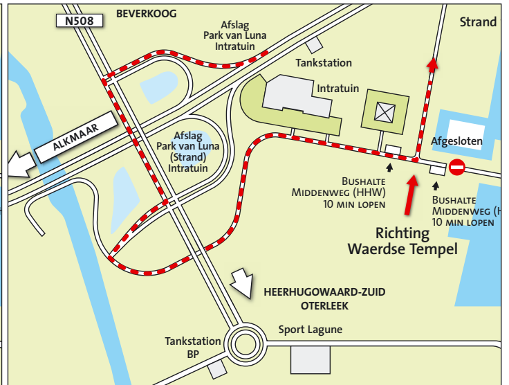
Route vanaf Leeuwarden - N242